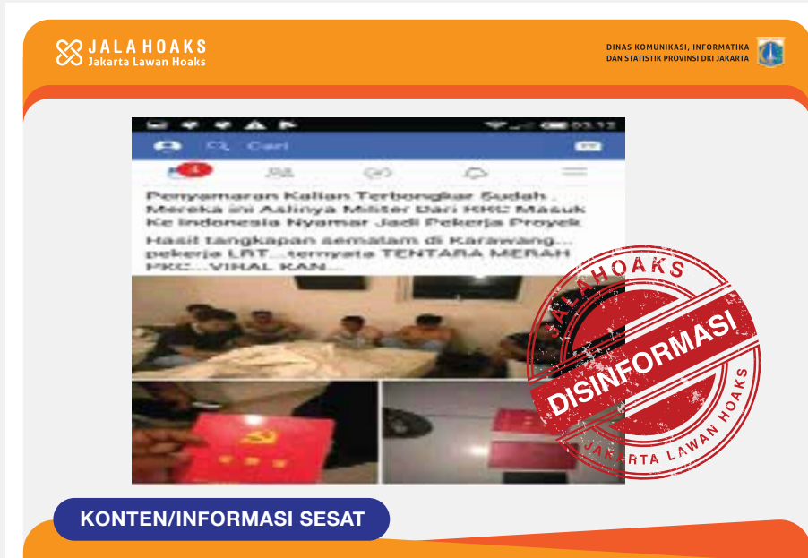
Foto Penyamaran Beberapa Orang Militer dari RRC Menjadi Pekerja Proyek di Indonesia